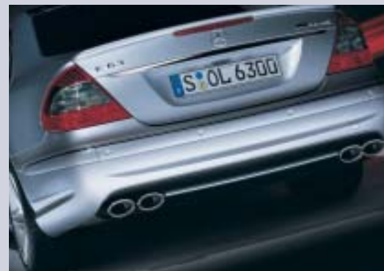
Exteriören på E 63 AMG inkluderar även en bakspoiler, kjolar runt om, samt AMG-avgasrör med två förkromade dubbla slutrör.