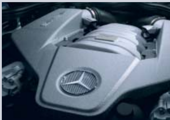
Den mäktiga V8-motorn i E 63 AMG monteras för hand i AMG:s anläggning i Affalterbach och signeras av ingenjören som byggt den.