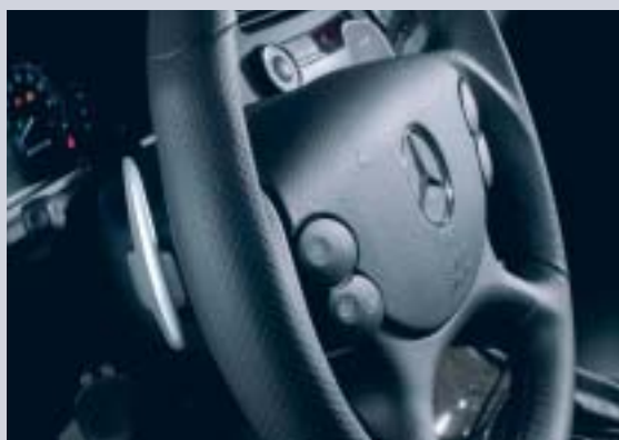
Välj mellan tre olika växelprogram: komfort, sport eller manuellt där du använder växelpaddlarna på AMG:s ergonomiska sportratt.